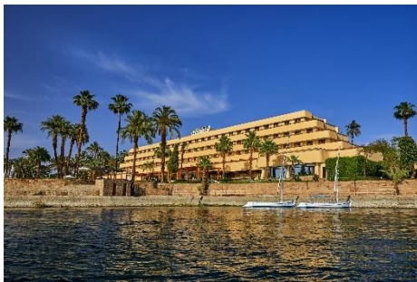
Steigenberger Resort Achi am Nil in Luxor