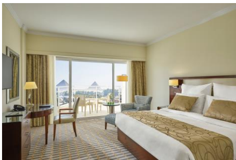
Deluxe-Zimmer Steigenberger Pyramids Cairo mit Blick auf die Pyramiden von Gizeh

Weitere Informationen und Buchung: www.hrewards.com