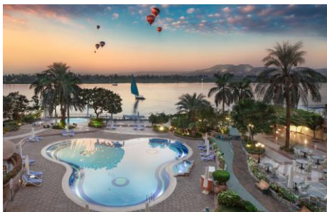
Steigenberger Nile Palace mit eigenem Bootsanleger und Nilpanorama