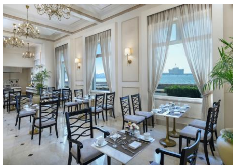
Restaurant im Steigenberger Cecil Hotel mit Blick auf das Mittelmeer