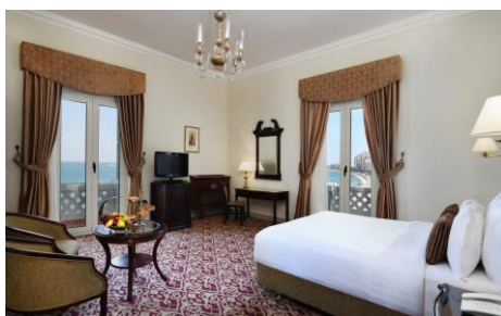
Junior Suite Steigenberger Cecil Hotel

Aktuelle Presseinformationen finden Sie in unserem Presseportal .